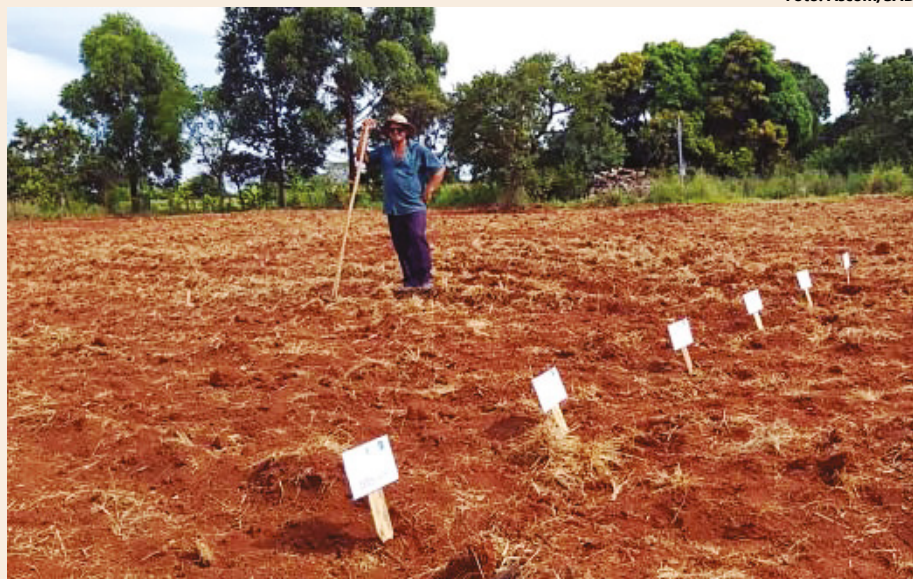
O Sebrae também estará presente para discutir a formalização do Microempreendedor Individual (MEI) no contexto rural

As palestras são especialmente direcionadas para aqueles que desejam regularizar suas empresas e obter o selo de qualidade