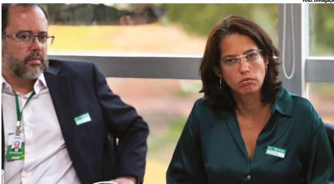
A Secretária do Entorno do Distrito Federal (SEDFGO) foi acionada para mediar uma solução para o problema