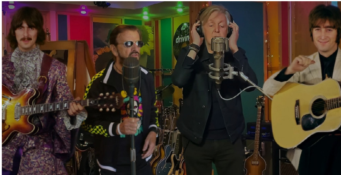
Beatles pós morte de John Lennon e George Harrison chega às plataformas de streaming com "Now and Then"

diz que deseja a pessoa que não tem mais - e que - às vezes - sente sua falta. Mas caso não seja interesse deste amor voltar, que seja assim ("mas se você tiver que ir, vá embora").