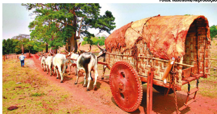
A passeata aconteceu no 1º dia de novembro