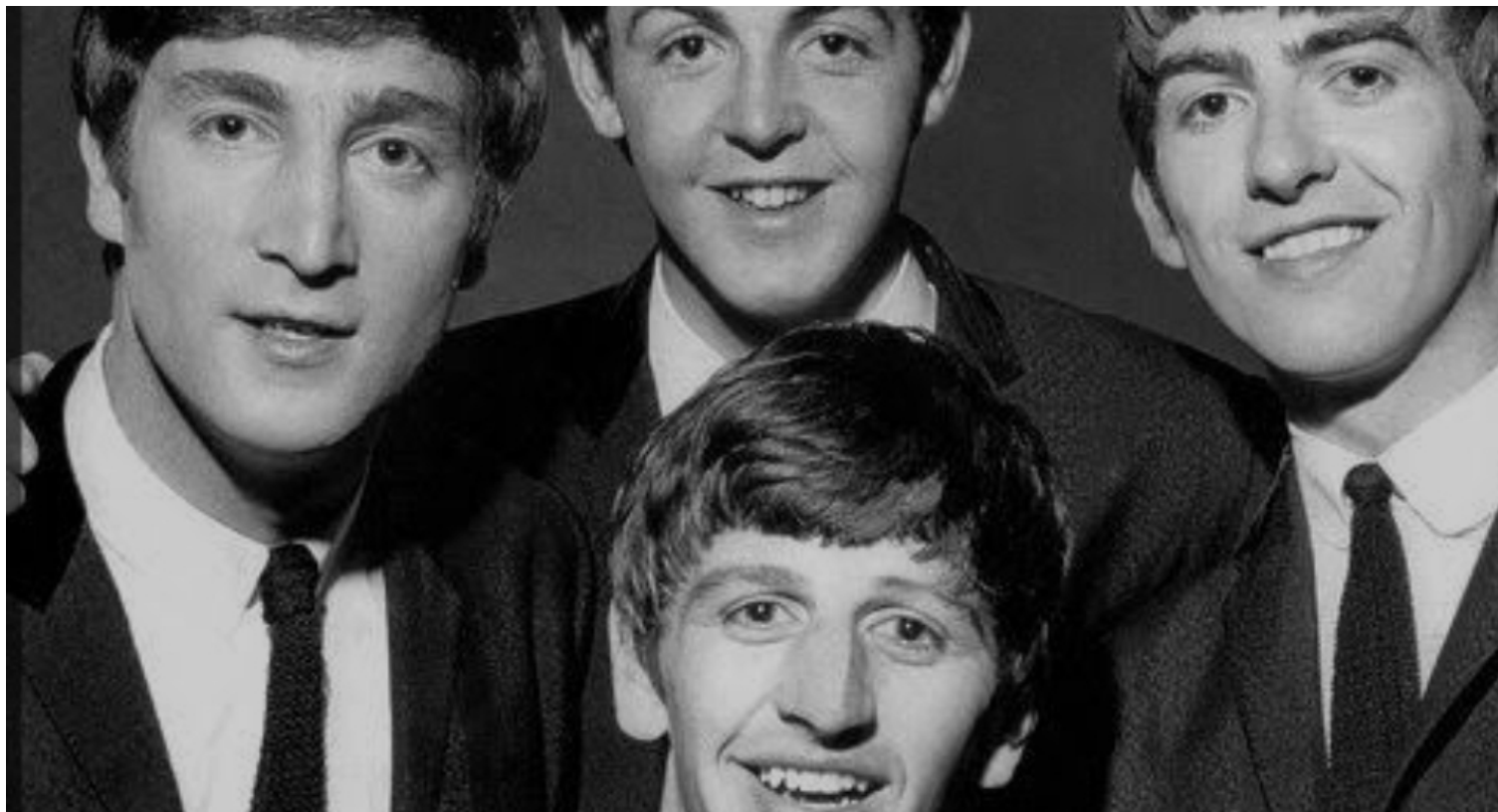
Beatles nos anos 1960: banda inglesa começou a carreira com hits como "Love Me Do"

A música trata de um rompimento - John já falou disso outras vezes. O interlocutor